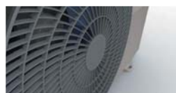
Особая форма воздуховыпускной решетки.