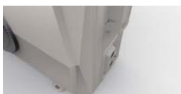
Оригинальная «граненая» форма.