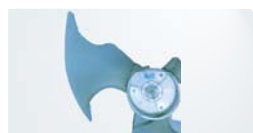
Продуманный бионический дизайн лопастей вентилятора. Форма «подсмотрена» в природе, поэтому очень эффективна.