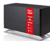
Oskar big Original black O-0410R