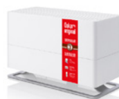
Oskar big Original white O-0400R