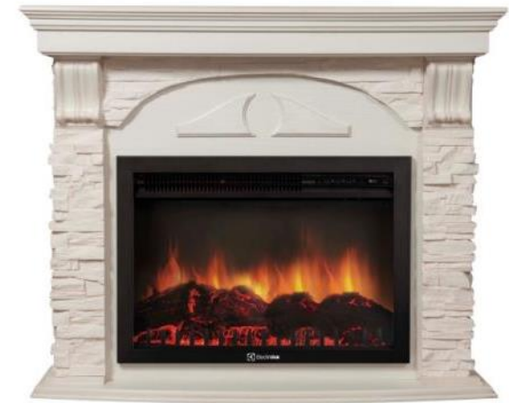
камень белый, шпон беленый дуб