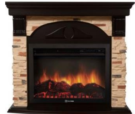
камень сланец натуральный, шпон венге