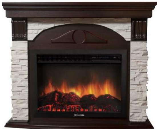
камень белый, шпон темный дуб