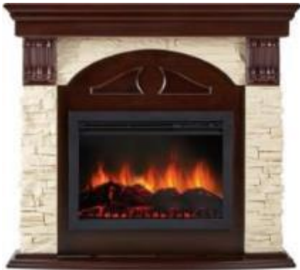
камень слоновая кость, шпон темный дуб