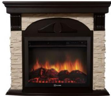
камень слоновая кость, шпон венге