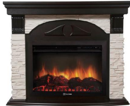
камень белый шпон венге