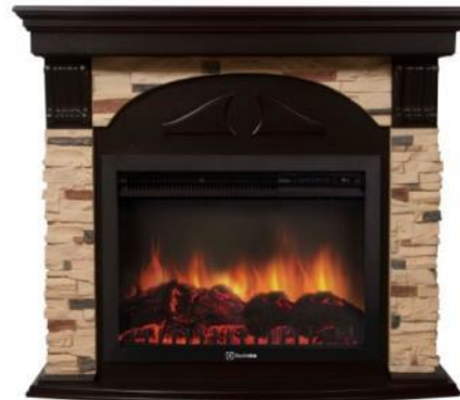
камень сланец натуральный, шпон темный дуб