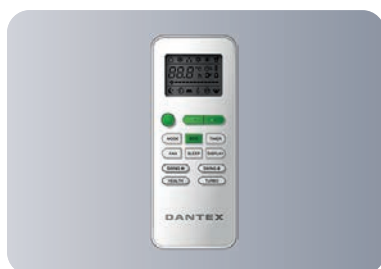
Функциональный пульт ДУ GYKQ-52E